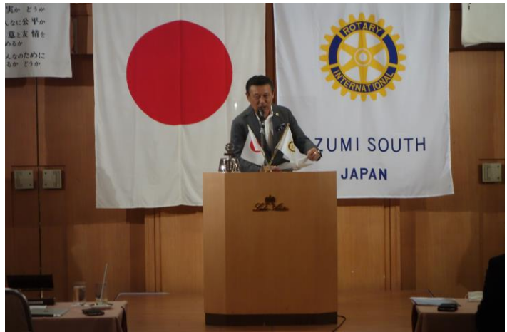
髭会長エレクトによる「PETS報告」